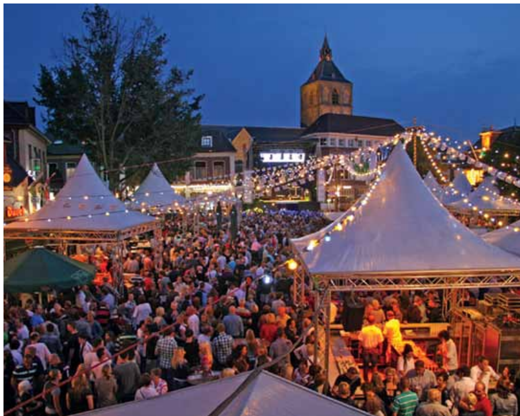
afb.01 Binnenstad Oldenzaal

Oldenzaal, de Glimlach van Twente, zo luidt de slogan van de Overijsselse gemeente. In Oldenzaal komt het Twentse naobarschap en de bescheidenheid tot een verrassende mix met een levendige en bruisende bourgondische cultuur. Zo is Oldenzaal bijvoorbeeld één van de weinige gemeenten boven de grote rivieren van Nederland waar carnaval uitbundig wordt gevierd. Elk jaar trekt de Grote Twentse Carnavalsoptocht ruim 100.000 bezoekers naar de “Boeskoolstad”. Ook buiten de carnavalstijd weet men de gemeente te vinden.