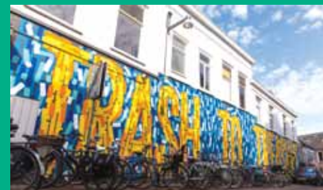
afb.01 Willemstraat [stationsgebied] afb.02 Grote markt Breda afb.03 Muurschildering als onderdeel van de Blind Walls Gallery

Junior ontwikkeld, waarmee ook de jeugd in contact wordt gebracht met de lokale verhalen, voorwerpen en plekken die zo eigen zijn voor de Brabantse stad.