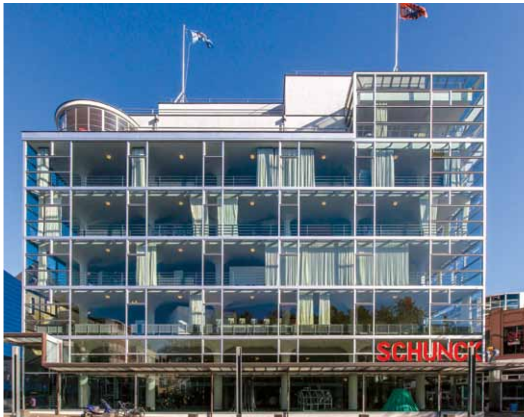
afb.01 Schunck cultuurcentrum, voormalig mijnwarenhuis

Heerlen is een nieuwe stad èn een zeer oude stad. Romeinen, Middeleeuwen en Mijnbouw vormen de drie voornaamste hoofdstukken uit haar geschiedenis. In de Culturele Agenda van de stad voor de periode 2013-2016 noemt de gemeente het koesteren van het erfgoed als één van de belangrijkste doelstellingen voor de komende jaren.