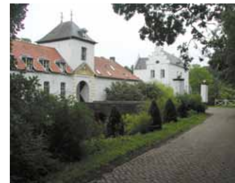
afb.01 Gemeentelijke monument Heideheim