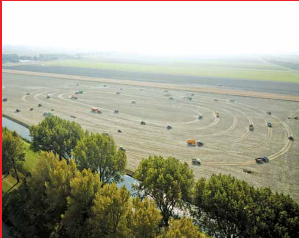
afb.01 Tractordans afb.02 Ringbiënnale

Koning Willem I gaf met de Wet op de droogmaking van de Haarlemmermeer het startsein voor de inpoldering. In 1840 ging bij Hillegom de eerste spade in de grond van de 62 kilometer lange ringdijk en vaart rondom het Haarlemmermeer; na vijf jaar graven was het meer omringd. Het landschap van de Haarlemmermeer biedt vergezichten, water, karakteristieke boerderijen en stedelijke skylines. De waterrijke geschiedenis is terug te zien in de monumenten fort bij Vijfhuizen en het gemaal Cruquius.