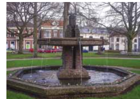
afb.01 Abtmanshuis afb.02 Fruitcorso afb.03 Fontein Kalverbos